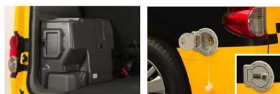
LPGタンク**2 (荷室後部左側)

ガソリン運転とLPG運転は、状況に合わせて自動で切り替わり、ガソリン車同様の快適なドライビングを提供。手動での切り替えも可能です。